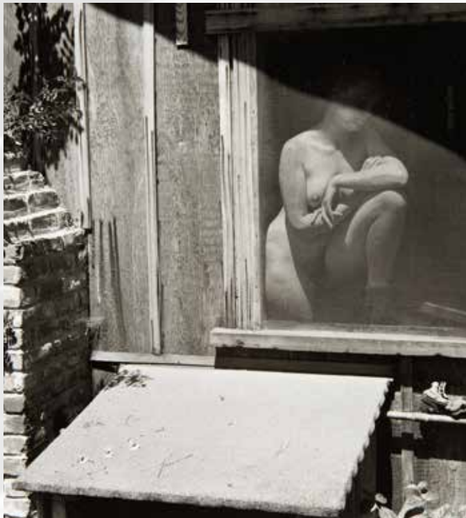
Spring, 1943