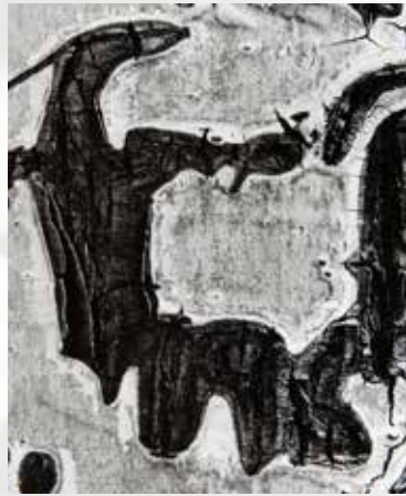
Abstract, Brett Weston