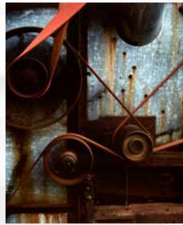
Combine Missouri, 1987, Cole Weston

Diese Geschichte beginnt im Jahr 1902, als Edward Weston von seinem Vater zum 16. Geburtstag die erste Kamera geschenkt bekommt. Schon ein Jahr später werden Edwards Bilder am Art Institute of Chicago ausgestellt. Er baut sich eine Existenz als Fotograf auf und geht für den Rest seines Lebens seiner Leidenschaft nach. Bereits zu Lebzeiten gilt er als Meister und Klassiker der künstlerischen Schwarzweiß-Fotografie. Seine Fotos von den Landschaften Kaliforniens, seine faszinierenden Natur- und Pflanzendetails und seine Aktfotografien machen ihn international bekannt.