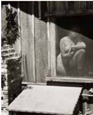
Spring, 1943