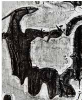
Abstract, Brett Weston