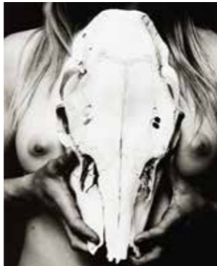
Nude and Horse Skull, 2013, Zach Weston

Zur Eröffnung der Ausstellung WESTON - Vier Generationen Klassiker der modernen amerikanischen Fotografie am Samstag, 01. Juli 2017 um 18.30 Uhr in den Kuns(t)räumen ...grenzenlos in Bayerisch Eisenstein laden wir Sie herzlich ein.