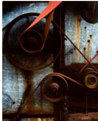
Combine Missouri, 1987, Cole Weston